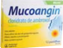
Mucoangin c/ 12 pastilhas R$ 10,49