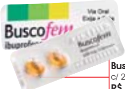
Buscofem c/ 2 cápsulas R$ 2,15