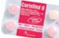
Coristina D c/ 4 comp. R$ 3,09