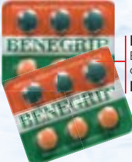
Benegrip Envelope c/ 6 comp. R$ 3,39