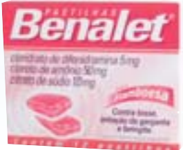
Benalet c/ 12 pastilhas R$ 7,59