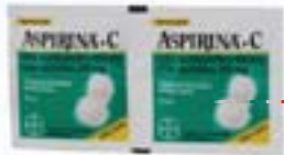
Aspirina C Adulto - Efervescente c/ 2 unid. R$ 2,55