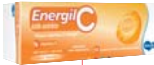
Energil C c/ 10 comp. - R$ 7,99