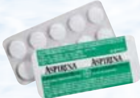
Aspirina Adulto c/10 comp. R$ 2,99