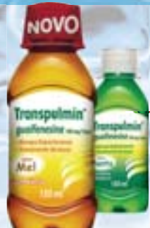
Transpulmin Xarope Adulto - 150ml R$ 12,09 cada