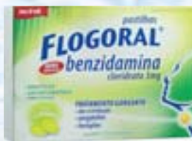
Flogoral c/ 12 pastilhas - R$ 7,90