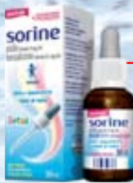
Sorine Infantil - 30ml R$ 5,90